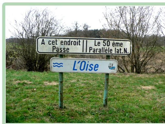
Exemple d'une signalétique informative

Il suffit de traverser la frontière et d'aller se promener aux environs de l'Abbaye de "Scourmont" - Chimay - pour se rendre compte de ce qu'il nous reste à réaliser.