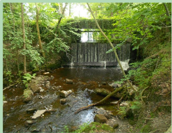
Cours d'eau "le Gland" qui relie les étangs de la Motte et de la Forge à Signy-Le-Petit

La signalisation représente l'image d'un territoire. Savoir où l'on se situe, connaître les lieux, obtenir des précisions permettent de se repérer, de se guider, d'en garder une mémoire visuelle et de la transmettre plus facilement.