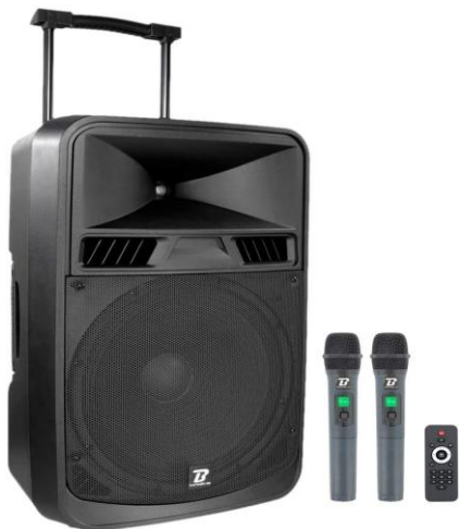
Une sono portable

Pour le son : Trois micros (2 sans fil, un filaire et un cravate) couplés à la sono autorisent la prise de parole en salle. Les membres connectés entendent et peuvent s'exprimer.