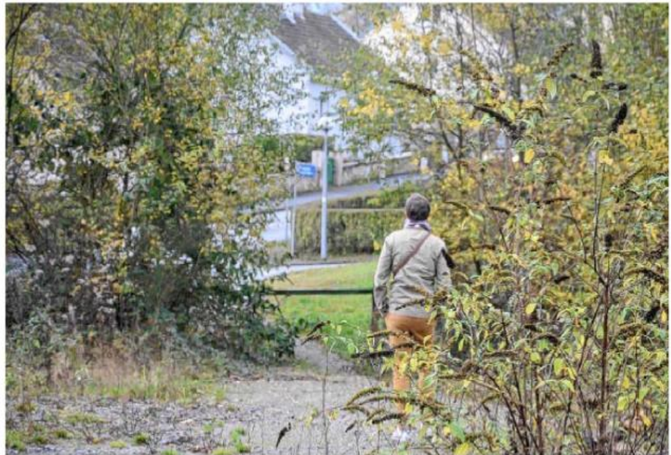
Le site visé pour accueillir la déchetterie de Revin, voisin des Bois-Byras, est excentré de Fumay mais appartient tout de même à la cité de l'ardaise.