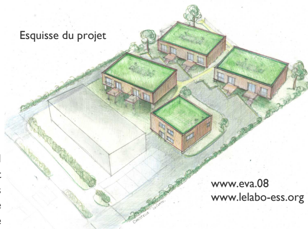
Esquisse du projet

Ces ressources seront sollicitées par le