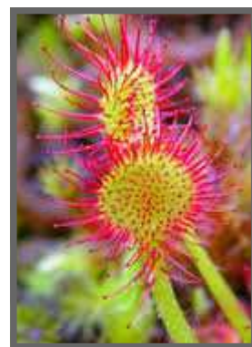
Drosera à feuilles rondes