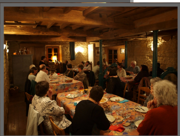
Repas conté du 26 avril

Stanislas Wiatr stanislas.wiatr@orange.fr