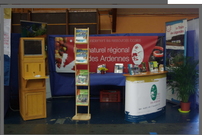
Bourse aux Minéraux à Bogny en avril