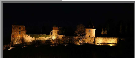
Château de Hergnies